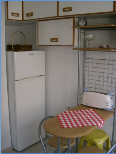
Cocina y baño: